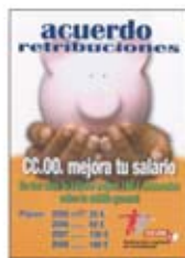
Gráfico evolución del ipc